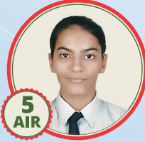
5 AIR Ruhani