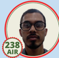
fofi u ncs