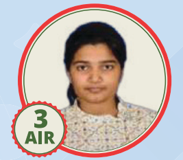
3 AIR Uma Harathi N