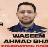
WASEEM AHMAD BHAT FOUNDATION COURSE CLASSROOM, LAKSHYA, ABHYAAS, PERSONALITY DEVELOPMENT