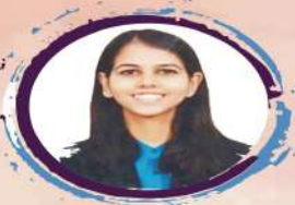
ISHITA KISHORE ABHYAAS, ESSAY TEST SERIES, PERSONALITY DEVELOPMENT