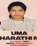
UMA HARATHIN ALL INDIA TEST SERIES, PERSONALITY DEVELOPMENT