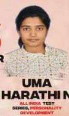
UMA HARATHI ALL INDIA TEST SERIES, PERSONALITY DEVELOPMENT