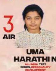
UMA HARATHI ALL INDIA TEST SERIES, PERSONALITY DEVELOPMENT