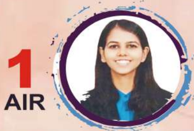
ISHITA KISHORE ABHYAAS, ESSAY TEST SERIES, PERSONALITY DEVELOPMENT

39 IN TOP 50 SELECTIONS IN CSE 2022 from various programs of VISIONIAS