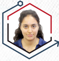
AIR 20 ANOUSHKA SHARMA