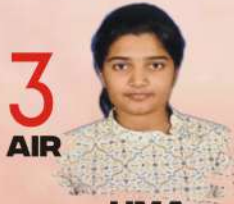
UMA HARATHIN ALL INDIA TEST SERIES, PERSONALITY DEVELOPMENT