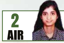
2 AIR GARIMA LOHIA