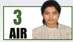
3 AIR UMA HARATHI N