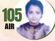
105 AIR DIVYA