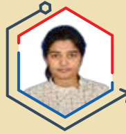
AIR 3 UMA HARATHI N