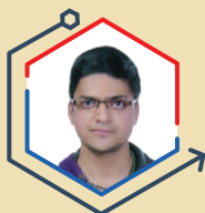
AIR 4 YASH JALUKA