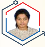
AIR 3 UMA HARATHI N