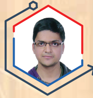
AIR 4 YASH JALUKA