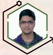
AIR 4 YASH JALUKA