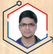
AIR 4 YASH JALUKA