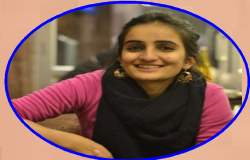
AIR - 93 GANDHARVA R.