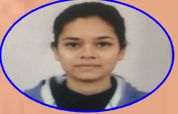
AIR - 212 GARIMAPANWAR