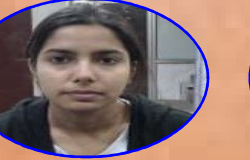
AIR - 646 SULEKHA