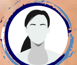
YOU CAN BE NEXT