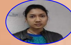
AIR - 230 MANALIKA