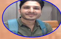
AIR- 627 LALIT