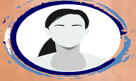
YOU CAN BE NEXT