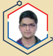
AIR 4 YASH JALUKA